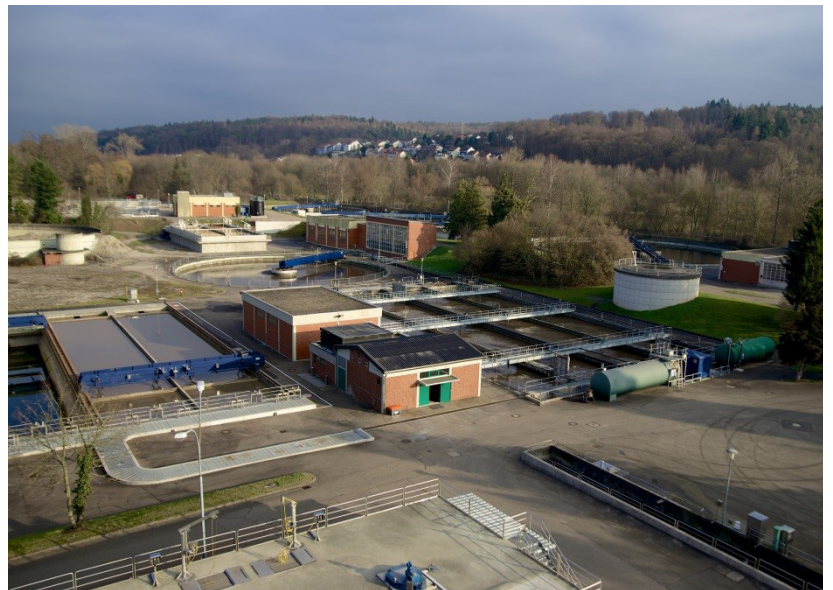
Abb. 1: Luftbild der Kläranlage Pforzheim von 2016

Um die Überwachungswerte sicher einhalten zu können, ist in Pforzheim eine diskontinuierliche Zugabe von der externen Kohlenstoffquelle (C-Quelle) in die vorgeschaltete und bei Bedarf in die nachgeschaltete Denitrifikationszone zwingend erforderlich.